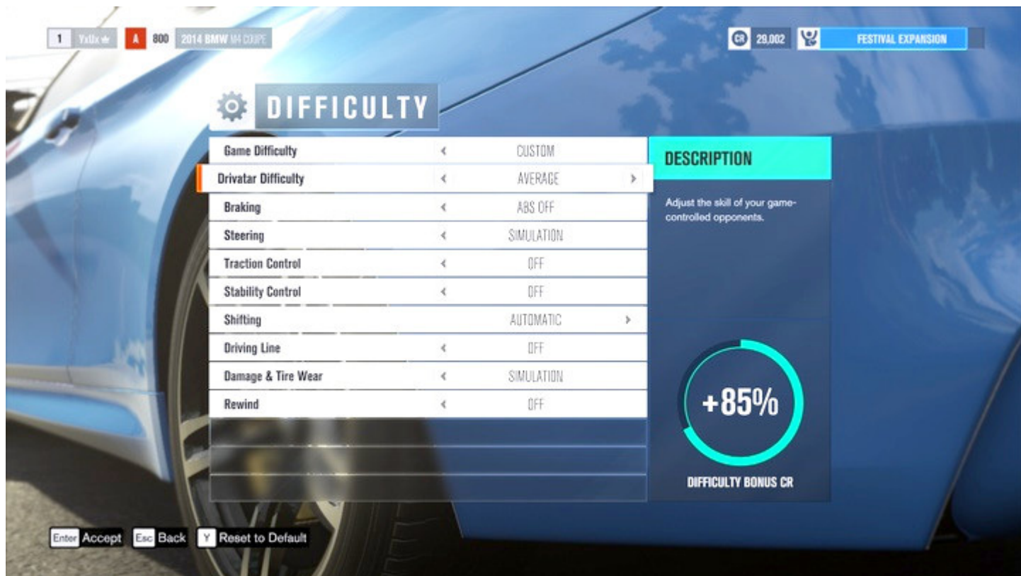
Tabela ustawień trudności i bonus kredytów widoczny w prawym rogu.

W tym rozdziale znajdziesz kilka podstawowych informacji na temat dostępnych ustawień trudności: co warto zmienić, ile kredytów dostaniesz za zmianę, jak wpływa dana opcja na rozgrywkę.