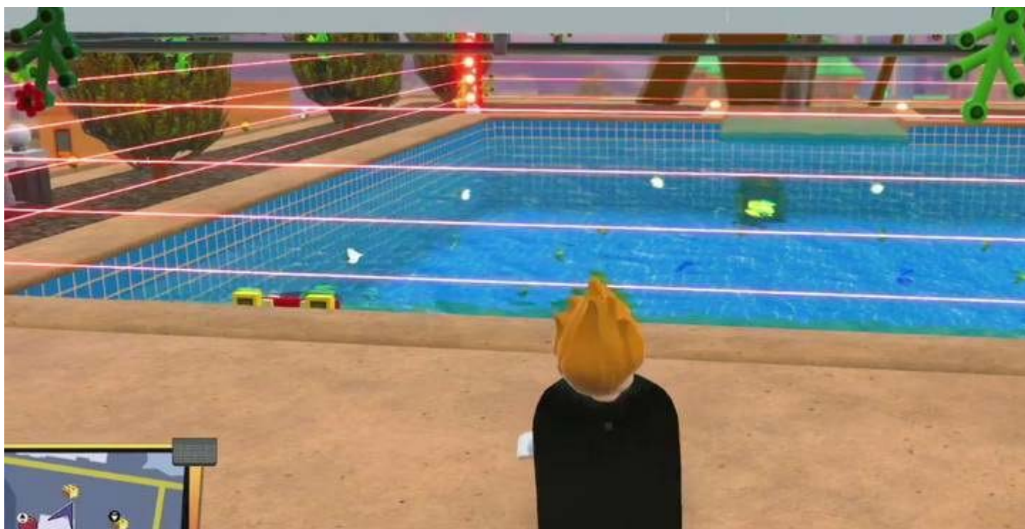
Klocek w basenie

Jeden ze złotych klocków w Zewnętrznym Municibergu znajdziesz w basenie przy domu Edny Mode. Basen otoczony jest laserami - najłatwiej przedostaniesz się przez nie z pomocą Violi (na lasery zadziała tak tarcza jak i niewidzialność).